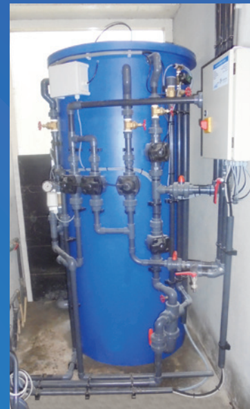
Installatie in bedrijf

Met een persoonlijk gesprek proberen wij u zo goed mogelijk te helpen en te adviseren.